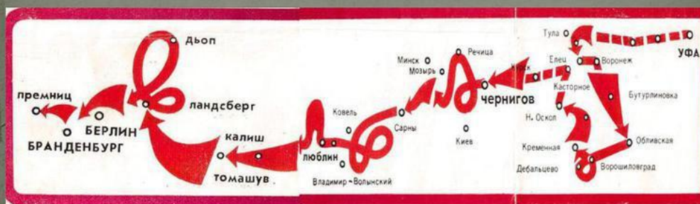
Боевой путь 112-ой Башкирской кавалерийской дивизии