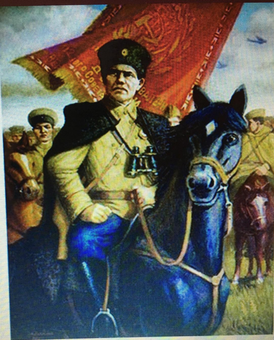
Лавренов, г. Уфа. «Генерал Шаймуратов», 2010. Хол